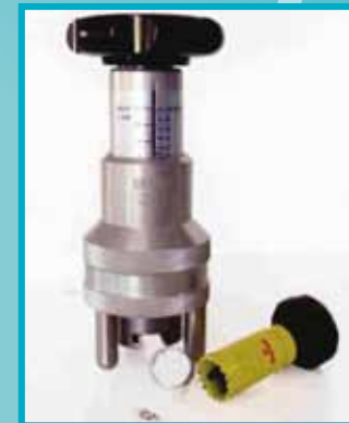
Elcometer Adhesion Tester