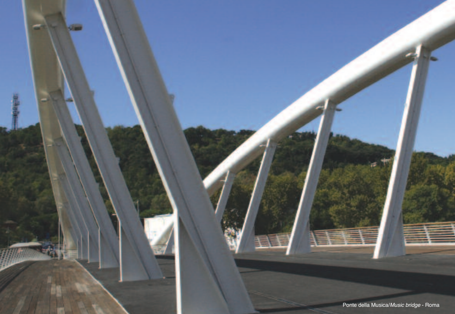
Ponte della Musica/Music bridge - Roma